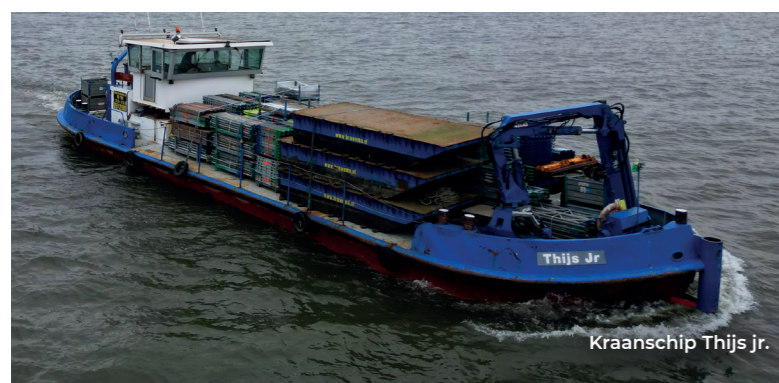
Kraanschip Thijs jr.

Als maritieme dienstverlener helpt Browema om bouw- en onderhoudsprojecten op en rond het water te realiseren. Met onze jarenlange ervaring op maritiem gebied maken wij bouwwerken zoals bruggen, pijlers en sluisen bereikbaar via het water met eigen materieel.